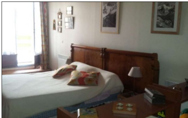
Maison - T5 - Bons (réf. ven-maisdiop)