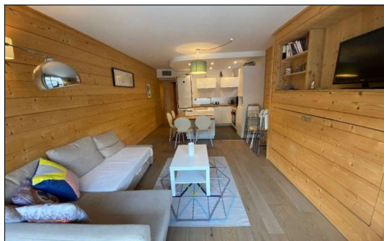
Appartement - T3 - Les deux alpes (réf. VENTE-ALTCLE)