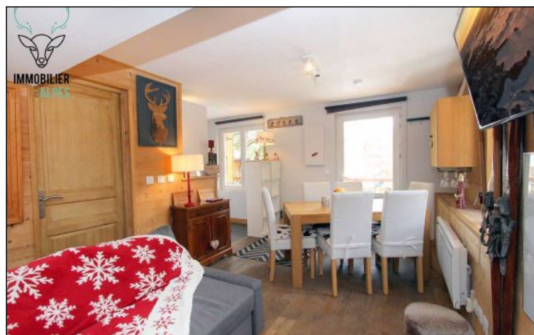
Appartement - T3 - Les deux alpes (réf. LOC-BELALP10)