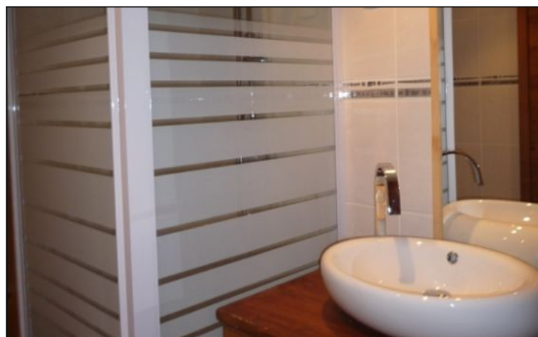
Studio - T1bis - Les deux alpes (réf. vente-serja)