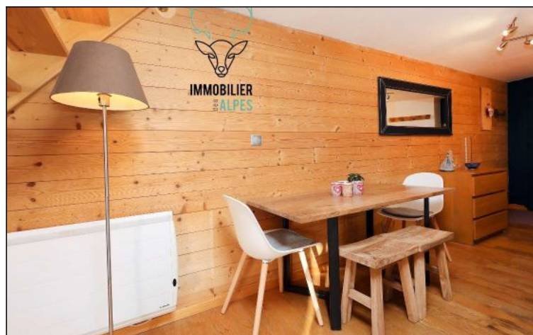
Duplex - T1bis - Les deux alpes (réf. loc-alpb8)