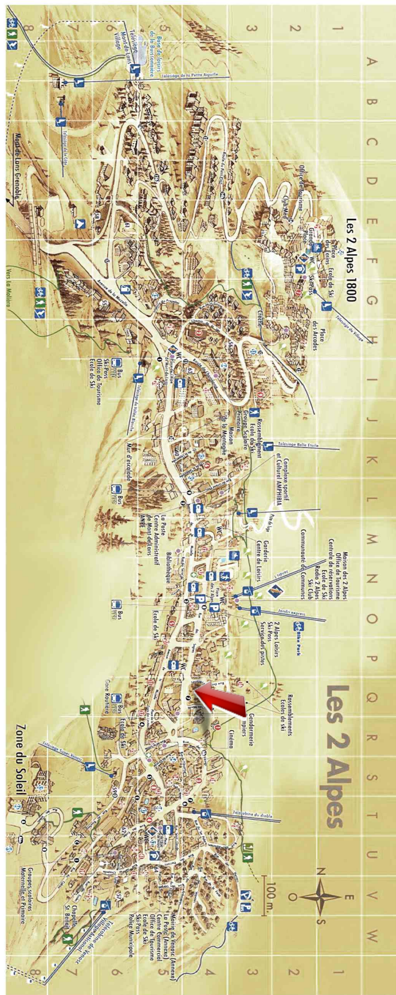
Appartement - T4 - Les deux alpes (réf. LOC-VIO12)