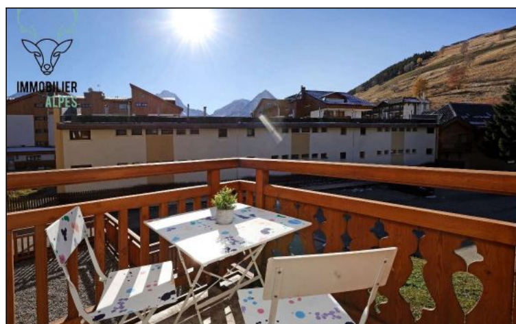
Studio - T1bis - Les deux alpes (réf. LOC-ALB104A)