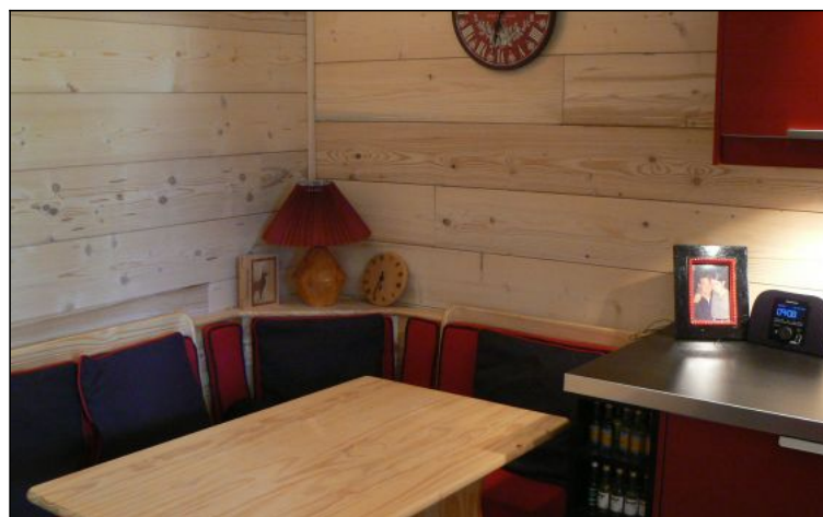
Studio - T1bis - Les deux alpes (réf. vente-lauvrdc)