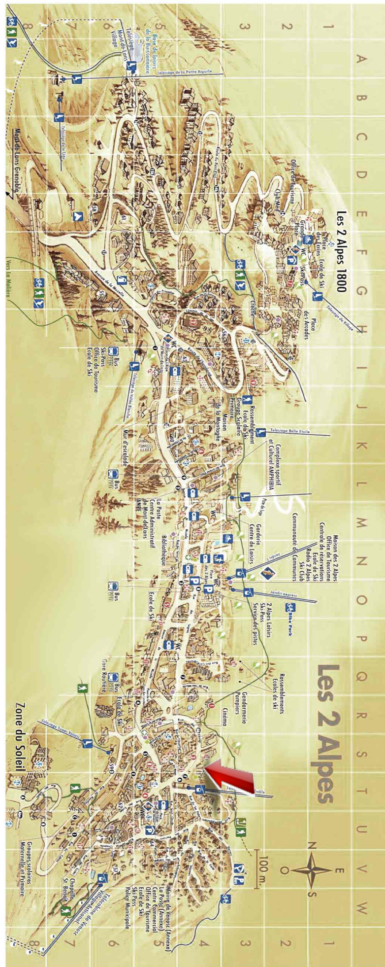
Studio - T1bis - Les deux alpes (réf. vente-lauvrdc)