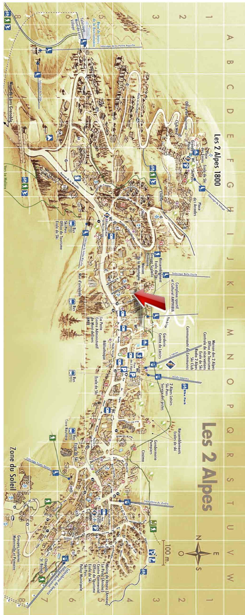
Commerce - Les deux alpes (réf. vente-aqua)