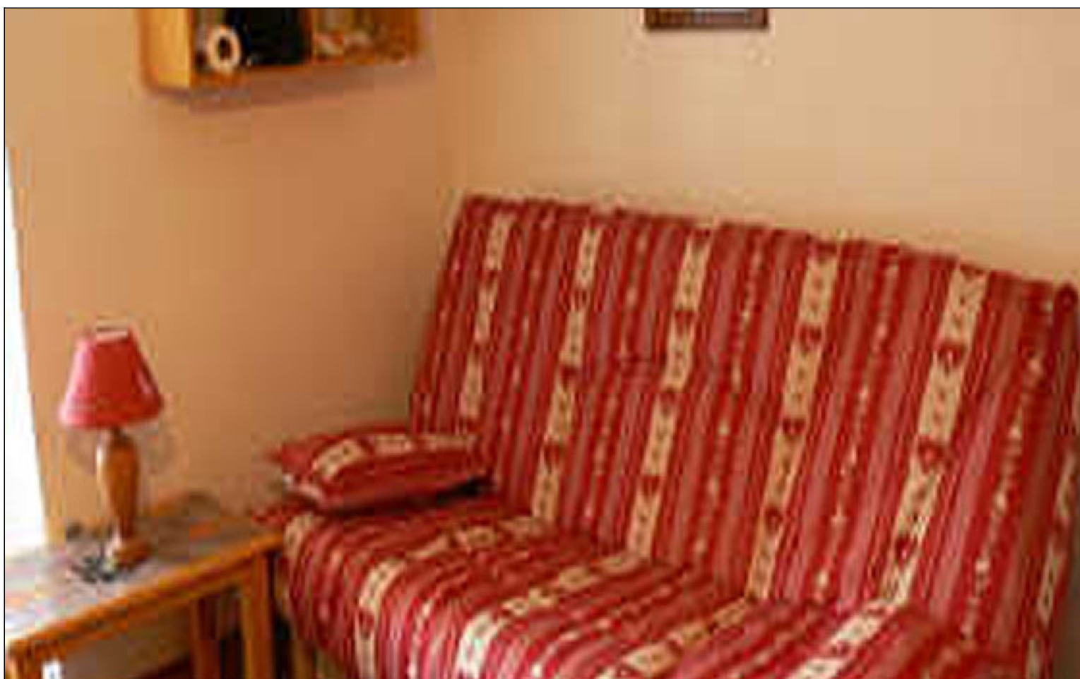
Studio - T1 - Les deux alpes (réf. vente-milon)